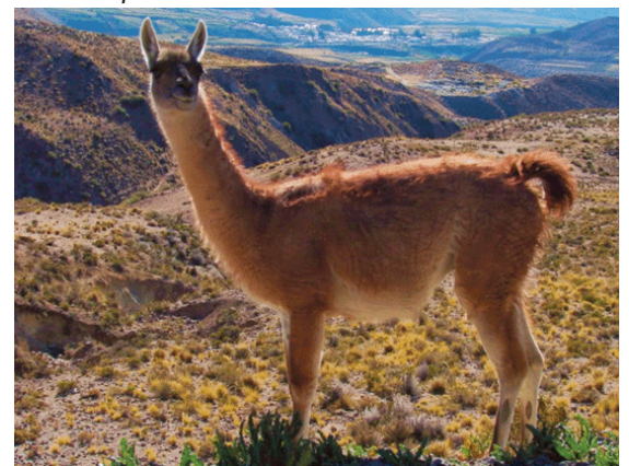
El guanaco también resultó afecto por los efectos de la introducción de llamas en la zona.

E n San Guillermo las vicuñas y los guanacos son presas importantes para los pumas, y los cóndores se alimentan de los cadáveres. Sin herbívoros silvestres en el menú, los pumas podrían recurrir al ganado para alimentarse hasta que las poblaciones de camélidos silvestres del parque se recuperen. Los cóndores también podrían tener que buscar comida fuera del parque, exponiéndose a riesgos como el envenenamiento por cebos tóxicos o el plomo de municiones de caza.