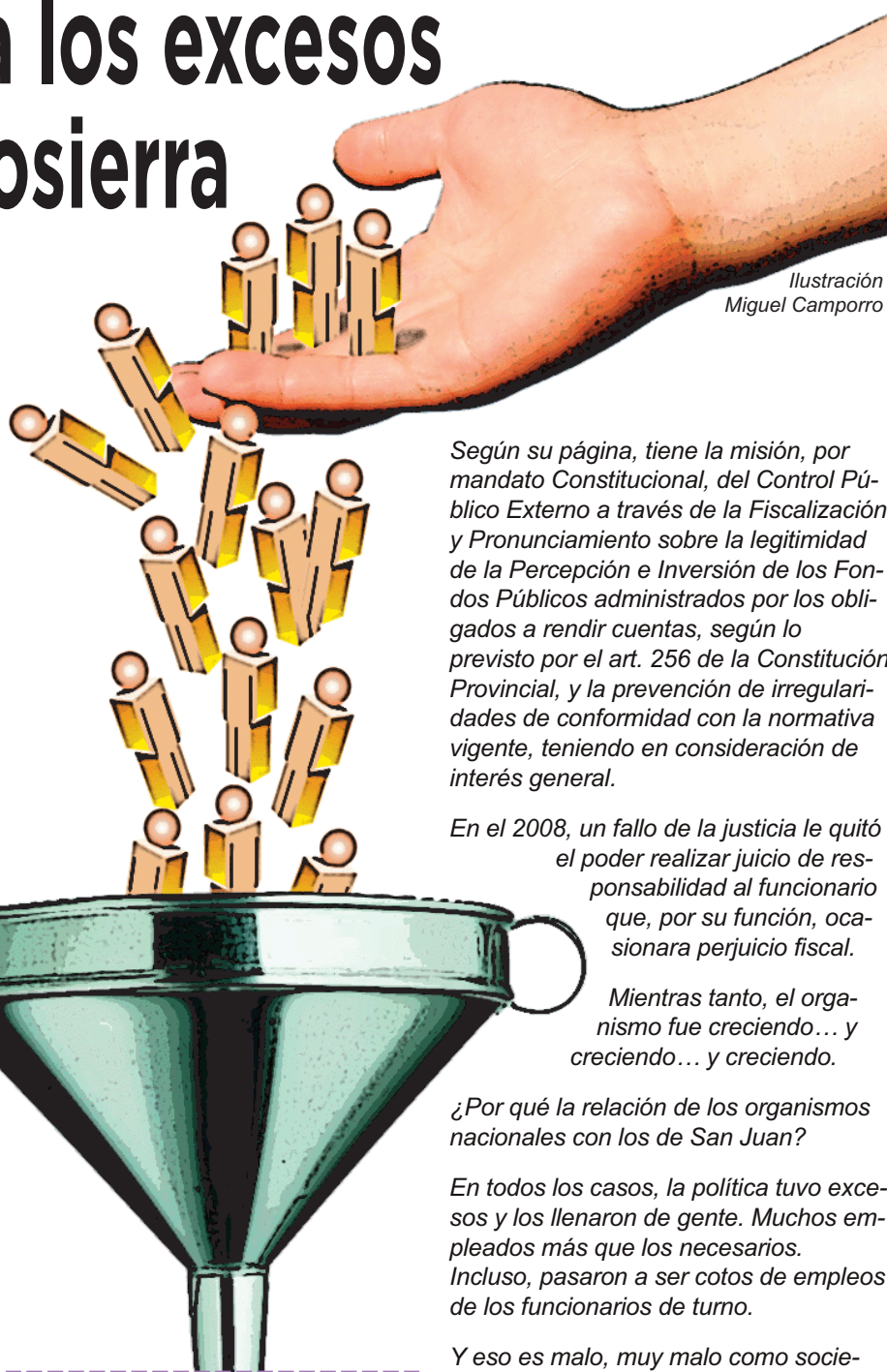
Ilustración Miguel Camporro

Otro organismo creado por la Constitución fue el Tribunal de Cuentas.