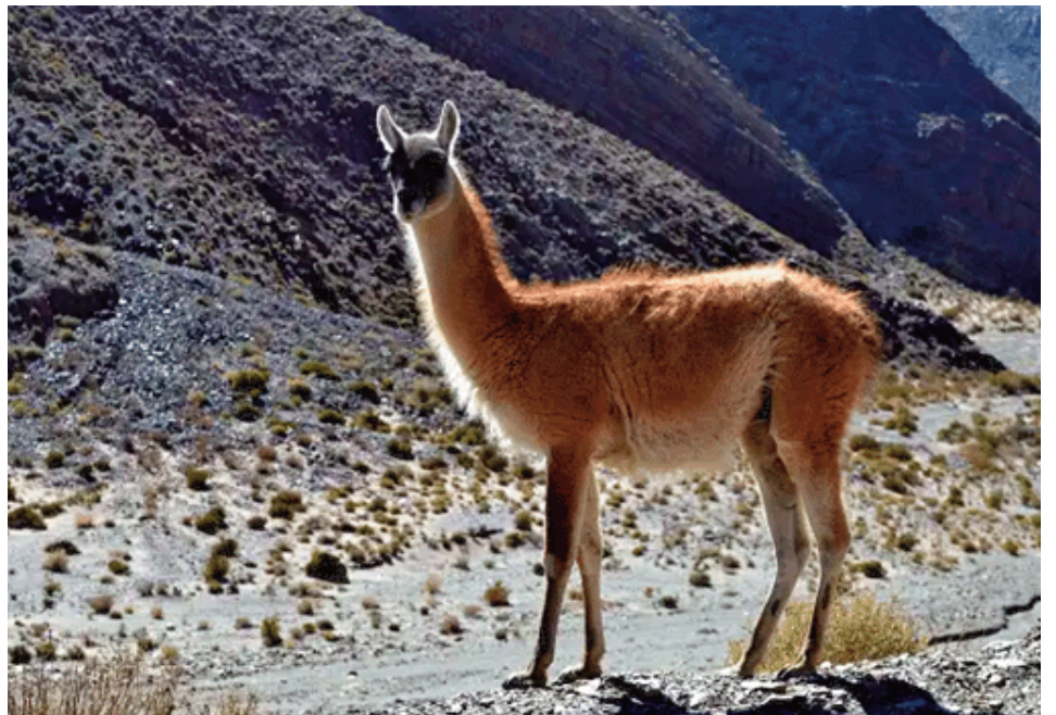
La llama fue introducida en la zona como parte de un plan oficial.