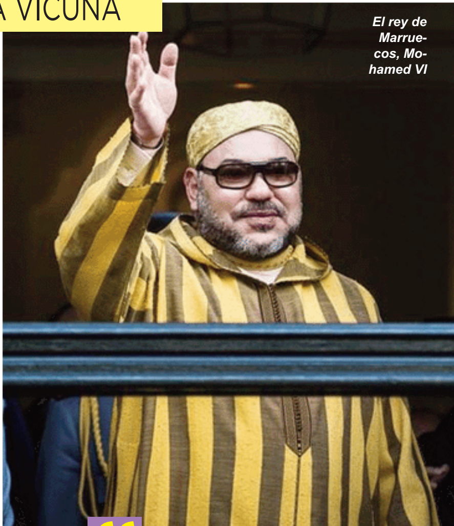
El rey de Marruecos, Mohamed VI

En teoría, es el traje para caballero más caro del que se tiene noticia hasta la fecha, con un precio hasta 10 veces superior al de un dos piezas de lana