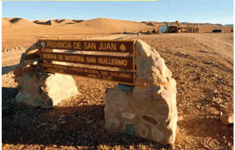
La Reserva de la Biósfera de San Guillermo está ubicada en Iglesia.

Eso trajo como resultados que entre 2013 y el inicio del estudio de la universidad californiana, en 2017, las poblaciones de guanaco y vicuña se redujeron en un 95% y un 98%, respectivamente. Luego, entre 2017 y 18 se perdieron casi tres cuartas partes más. En 2019, los investigadores ya no pudieron encontrar animales en el área de los censos del estudio. No hay cifras oficiales sobre la cantidad de estos animales que habitaban el suelo