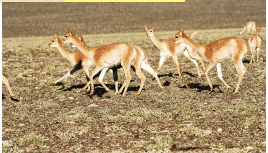
Las vicuñas no estaban preparadas para una enfermedad como la sarna, que las diezmo.