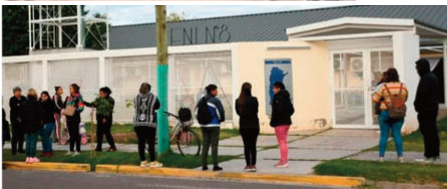
Escuela de Nivel Inicial (E.N.I.) N°8