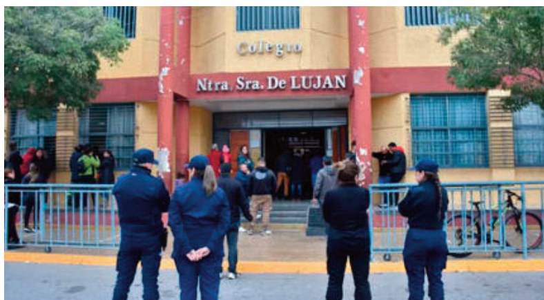
Colegio Nuestra Señora de Luján