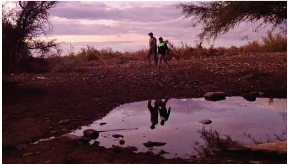
Guayaupa significa “ojo de agua” en la lengua de los pueblos originarios.

Guayaupa está en una zona árida. Es por eso que desde varios kilómetros antes de llegar al lugar, cuando se circula por la huella, se pueden ver las palmeras, los eucaliptus centenarios, los pimientos y algarrobos que dan algo de sombra al lugar. Los lugareños lo conocen bien, al igual