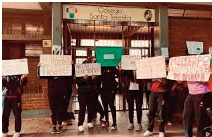
Colegio Santa Teresita

Desde el colegio nunca hablaron con los padres y esto desató una batahola en la puerta del colegio. Siete meses después la acusación no pudo ser sostenida y el docente fue absuelto de toda responsabilidad.