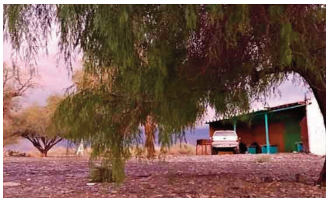
Acondicionaron un sitio para que la gente pueda pasar el día. Hasta hay parrilleros.

Los Baños de Guayaupa, la capilla de la Medalla Milagrosa, el oratorio de la Difunta Teresa, los petroglifos, las Cuevas del Quemado, la Quebrada del Gato y Agua