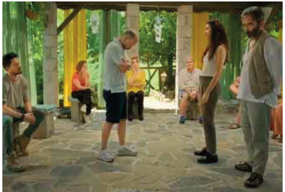
La miniserie turca Mi otra yo en Netflix , trata el de las constelaciones familiares. En 8 episodios refleja la historia de de amigas que van descubriendo cómo sus antecesores marcaron sus vidas.

Ministerio de Salud ni de Educación de la Nación que avale la formación en esta temática.