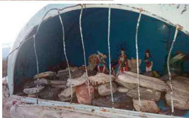
En el sitio hay grutas y varios altares que la gente confeccionó a modo de promesa.