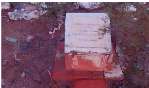
En Guayaupa hay una tumba con una placa recordatoria. Aunque no sale el nombre de la persona que está sepultada allí, dicen que se trata de un hombre que durante años cuidó el lugar.

A Guayaupa se llega por la calle El Bosque. Hay que pasar el complejo de San Expedito de Angaco. A pocos kilómetros de este, termina el asfalto y sigue una huella que está en buen estado. Hay buena señalización. Al llegar al sitio donde están las banderas, hay que doblar a la izquierda (norte), y de ahí andar unos 20 kilómetros. El paraje se encuentra a mano izquierda y está sobre la huella, que es la misma que conduce al oratorio de la Difunta Teresa.