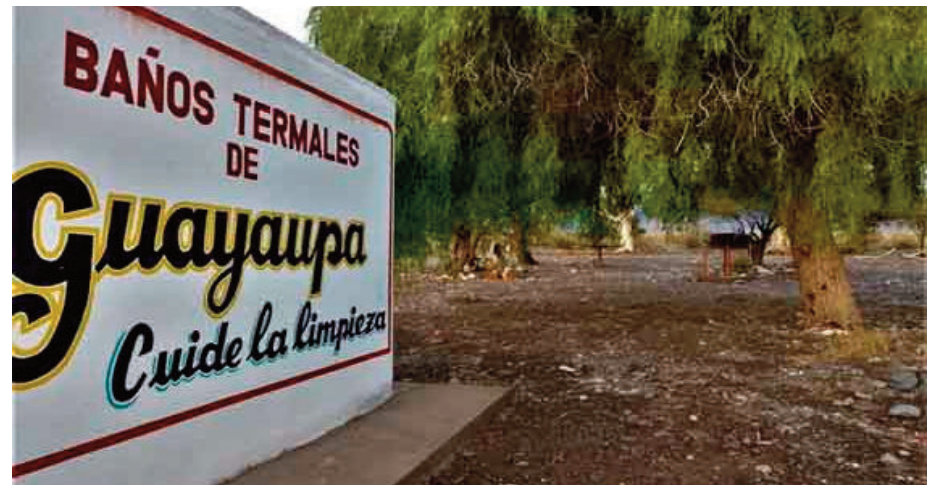
Los baños termales fueron refaccionados recientemente.

que los amantes de los caballos, ya que es una tradición pasar por este paraje cada vez que realizan la Cabalgata a la Difunta Teresa. Pero durante décadas estuvo abandonado y no había instalaciones adecuadas para disfrutar de las aguas termales y sus beneficios. Hubo varios intentos y muchos proyectos, pero nunca se ejecutaron. Hace un año, el Municipio de Angaco, decidió armar una ruta de turismo religioso, que incluye varios lugares. Este es uno. Y si bien