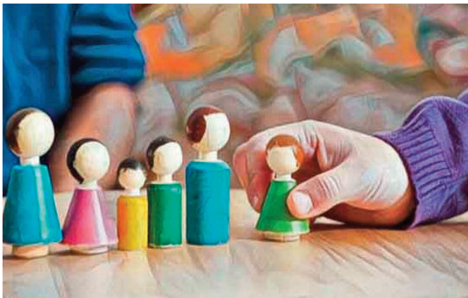
La Federación de Psicólogos de Argentina, afirma que los llamados consteladores “no adoptan en su totalidad el corpus de una teoría psicológica reconocida y vigente”.

La constelación consiste en entender las estructuras familiares que marcaron patrones en la conducta y que terminarían afectando la vida diaria. A través de dinámicas grupales o indivi-